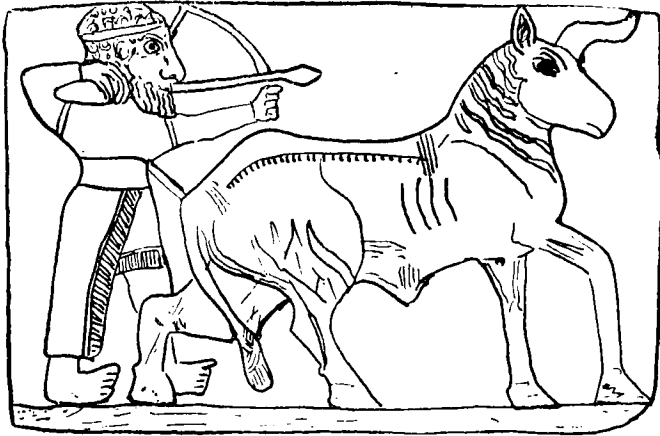
F. 19. LA CHASSE AU TAUREAU - TELL HALAF - N° 126

Les scènes religieuses représentées sur cet obélisque sont à rapprocher de celles que l'on trouve gravées sur les cylindres syro-hittites du second millénaire.