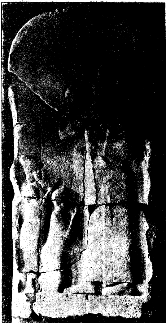
F. 20.-Stèle du roi Assarhaddon - Tell Ahmar - N° 47