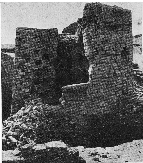
צ'ור א. שובך-יונים מהטיפוס הקדום יותר בקראניס.