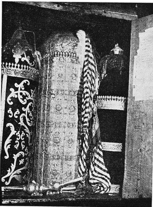
ציור ד'. ספרי תורה בתיקיהם, שרידי שמורים בהכרון עד שנת תרצ"ט.