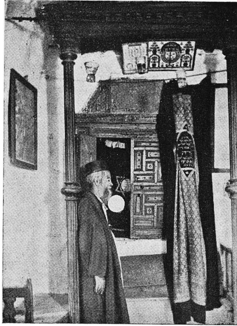
ציור ג'. ארון קודש שהובא מבית הכנסת החרב בעזה.