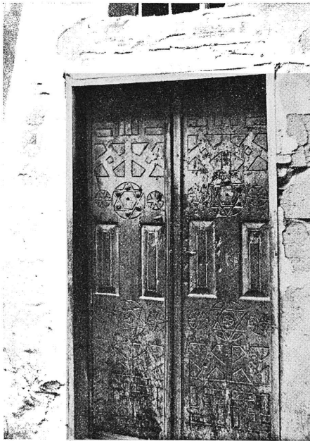
ציור ה'. דלת היצונה שהובאה מבית הכנסת החרב בעזה ונקבעה בפתח צדדי בבית הכנסת בחברון.

מבית הכנסת העתיק בעזה הועברה לבית הכנסת של אברהם אבינו גם הדלת העתיקה, העשויה עץ-שיקמים. בחברון היא משמשת דלת צדדית, הנפתחת לרחוב. גם היא מקושטת קשוחים נאים, מלאכת שיבוץ בעצים יקרים (ציור ה').