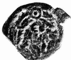
צילום מס. 4

פרט נומיסמטי מעניין הוא, שבמטבעות, שתוארו למעלה, שתי זרועות העוגן הן גבוהות יותר והמרחק ביניהן צר יותר מאשר בעוגן המצויר על מטבעות הורדוס הגדול מהטיפוס עוגן/קרני שפע. צורת העוגן בטיפוס החדש היא בדיוק כצורתו על מטבע אחר של ארכילאוס (ראה צילומים 3 ו-5).