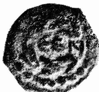
צילום מס. 5

כל הצילומים מובאים בהגדלה פי שתיים (2x1).