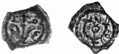
צילום מס. 1