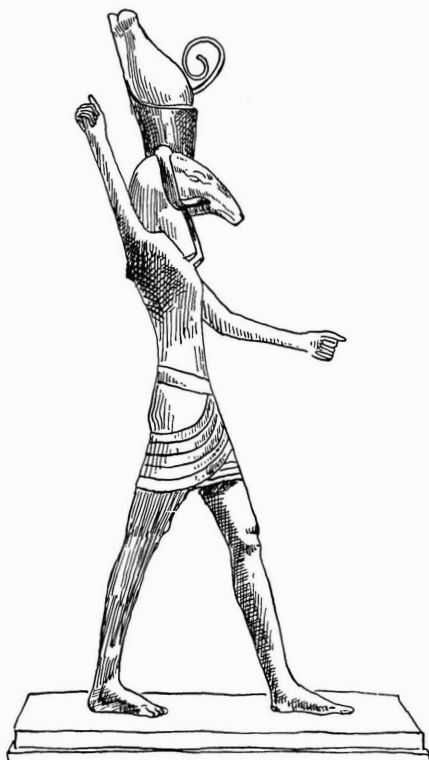
ציור 2. פסל הברווזה מקופנהגן

החיקסוס בלבד, כפי שמעיד, למשל, הכתוב בפאפירוס של סלייה (2) . המלך אפפירע עבד אל האל סת "בכל הארץ ובנה לו מקדש ליד בית מגוריו; (המלך) יאריך ימיו, ירבה עשרו ואוננו למען ישכים מדי בוקר בבוקר להקריב את עולת יומו לסת" וכר'. סיוע לפאפירוס זה, המלמדנו על עבודת אלהים אחרים במקום אמון־רע בתקופת החיקסוס, הם דבריה הבאים של חאתשפסות (שמלכה לאחר תקופת החיקסוס במצרים) בזיקה לאותה תקופה: "הרי איש לא נהג עוד לפי מצוותיו של רע" (3) .