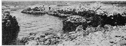
חרבות עיר-הנמל רשפון (ארסוף)

רשפונה "אשר על שפת הים העליון" היא העיר אפולוניה – אַרְסוּף הידועה לנו ממקורות שומרונים בשם רעשפאן (=רִשְׁפוֹן) (22). לדעתי היה "רשפון" שמה הקדמון של העיר, אבל היו משתמשים גם בצורת אַרְשָׁף (מכאן אַרְסוּף).