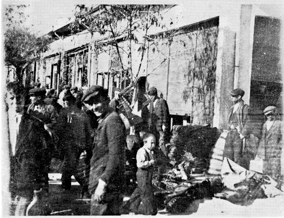
Res. 13— Kırşehir, halı pazarı'ndan görüntü, 1940-1950.