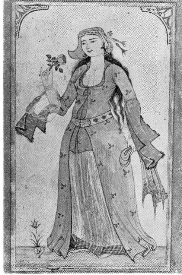
Res. 4— Gül tutan kadın. Levni, 18. yüzyıl Osmanlı. (TKSM, H. 2164, 19v).