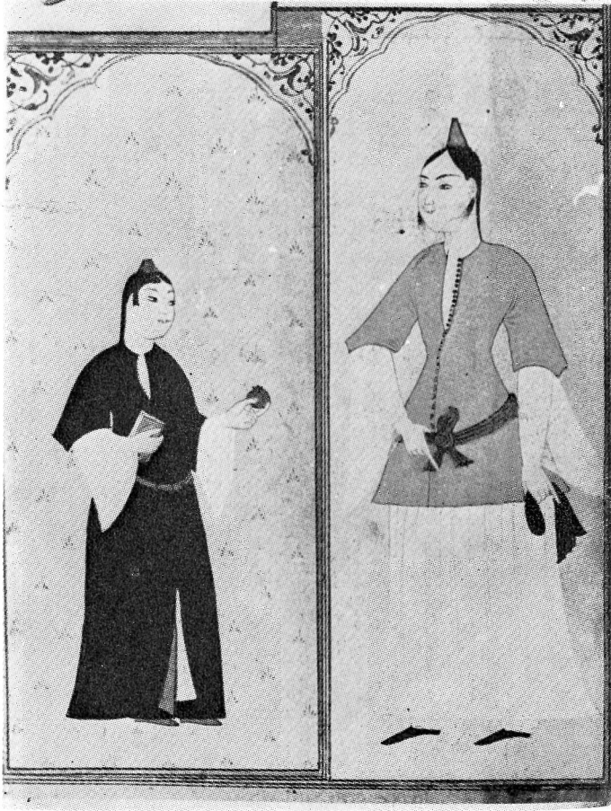
Res. 5— Nar tutan kadınla kuşağını tutan kadın. 17. yüzyıl Osmanlı, (TKSM, B. 408, 25v).