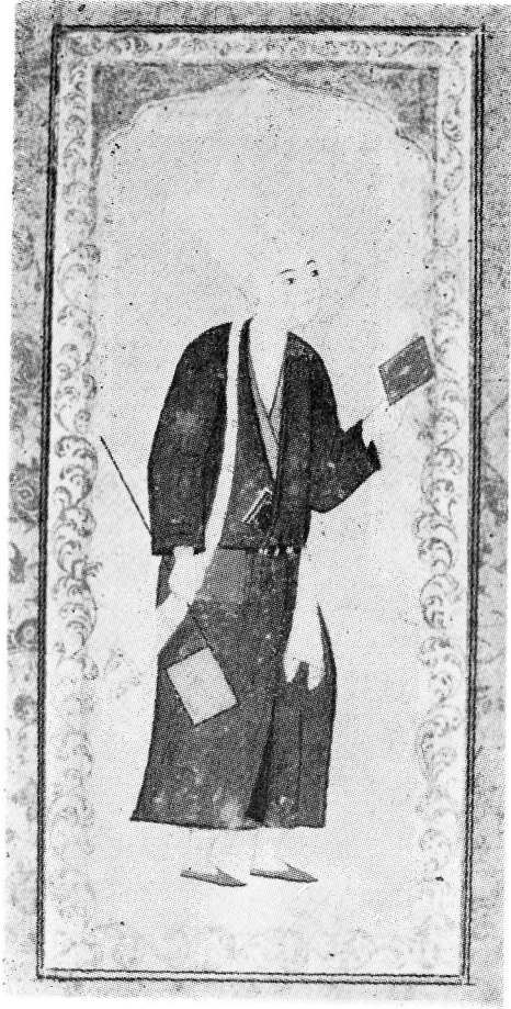
Res. 13— Okuyan derviş. 17. yüzyıl Osmanlı. (TKSM, H. 2168, 31r).