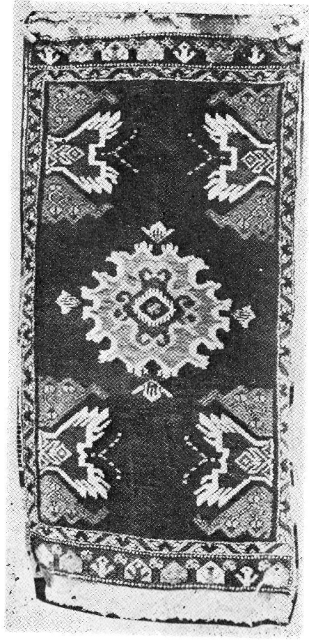
Res. 19- Kırşehir, yastık halısı (Mucur yastığı), 1950-60, 1.00x60 cm.