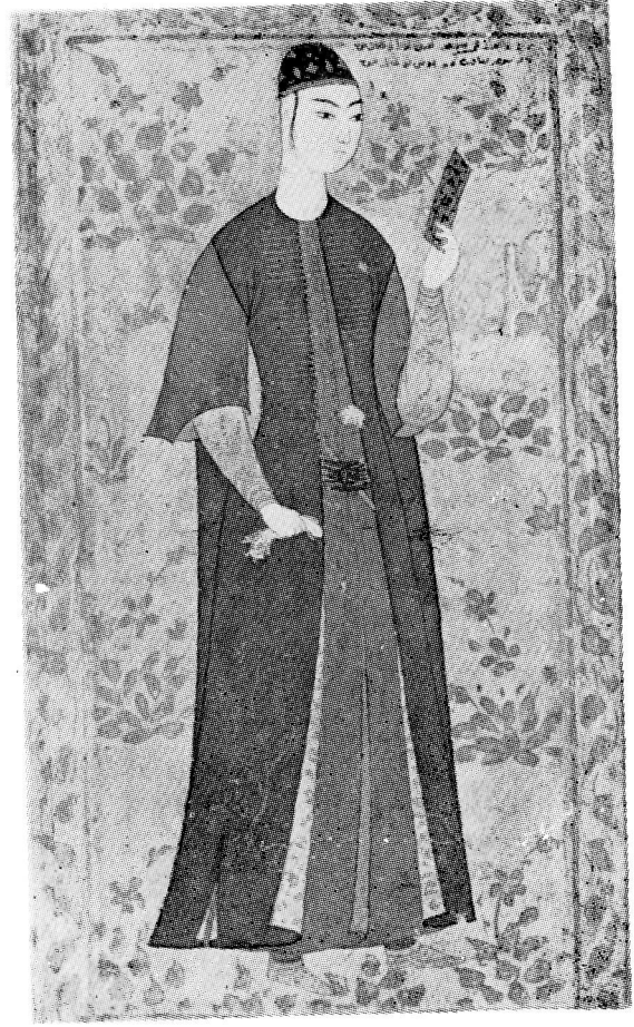
Res. 10— Okuyan genç. 17. yüzyıl Osmanlı. (TKSM, H. 2169 17r).