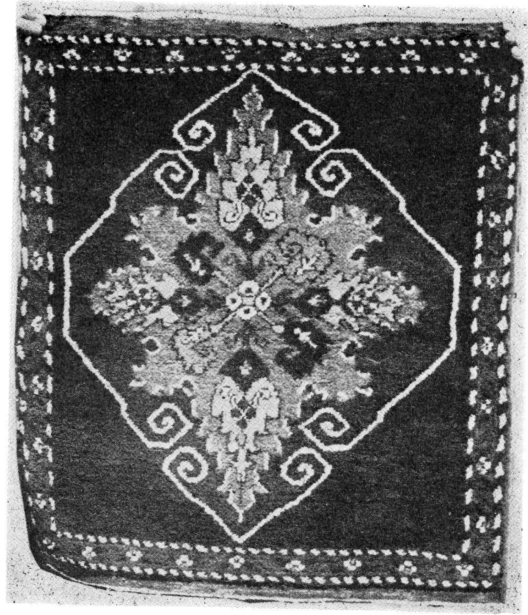
Res. 20- Kırşehir, Minder halısı, 1970-75, 60x60 cm.