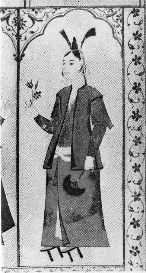
Res. 3— Çiçek tutan kadın. 17. yüzyıl Osmanlı. (TKSM, B. 408, 9r).