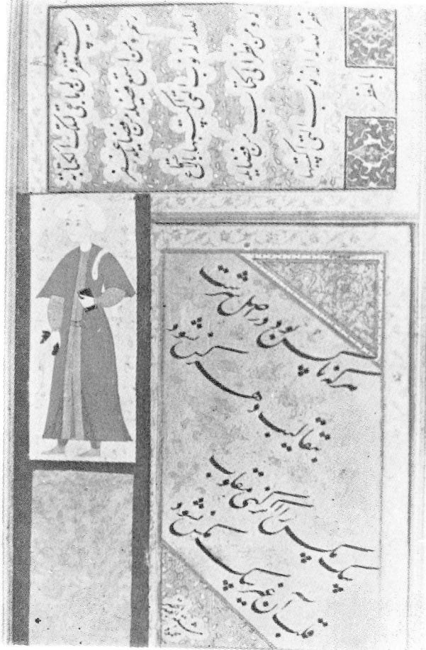
Res. 11— Kitap tutan genç. 17. yüzyıl Osmanlı. (TKSM, H. 2159, 17r).