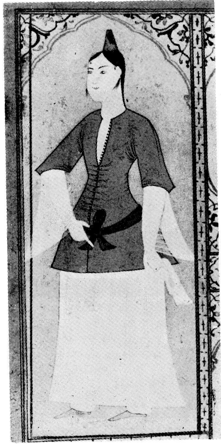
Res. 1— Kuşagını tutan kadın. 17. yüzyıl Osmanlı. (TKSM, B. 408, 15r).