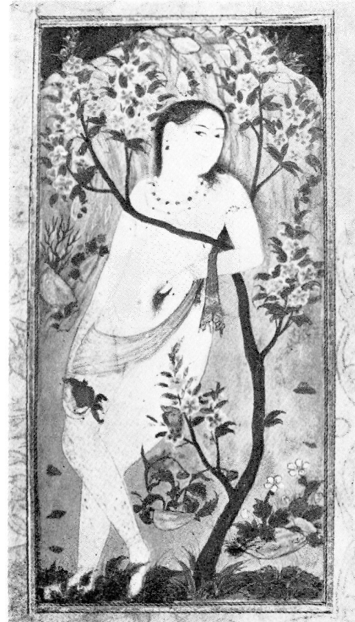
Res. 8— Çıplak kadın. 17. yüzyıl Osmanlı. (TKSM, H. 2168, 30r).