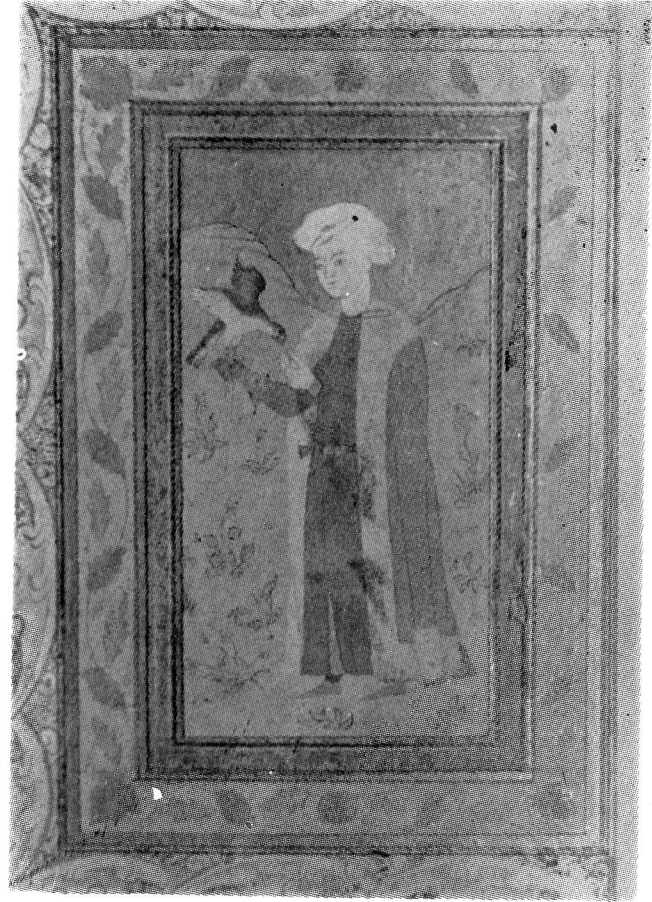
Res. 14— Atmacalı genç. 17. yüzyıl Osmanlı. (TKSM, H. 2158, 10r).