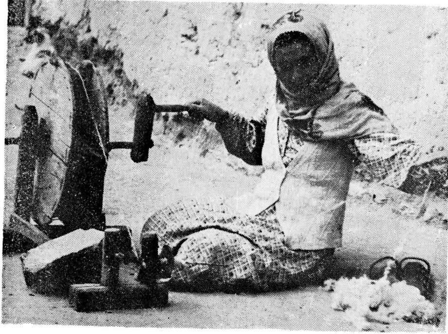
Res. 14- Kırşehir, ahşap çıkırık, 1940-1950.