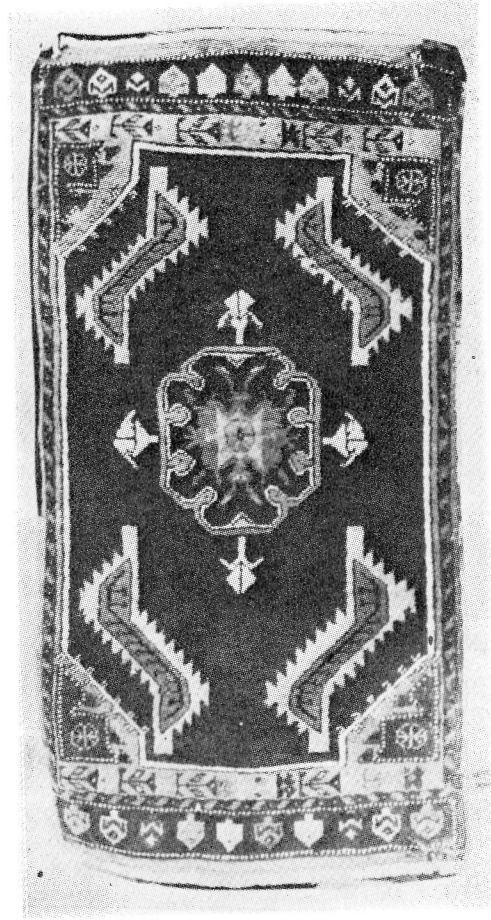
Res. 18- Kırşehir, yastık halısı, (ayaklı yastık), 1970, 100x60cm.