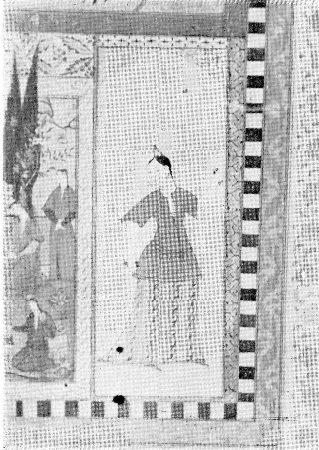
Res. 7— Rakkase. 17. yüzyıl Osmanlı. (TKSM, B. 408, 14r).