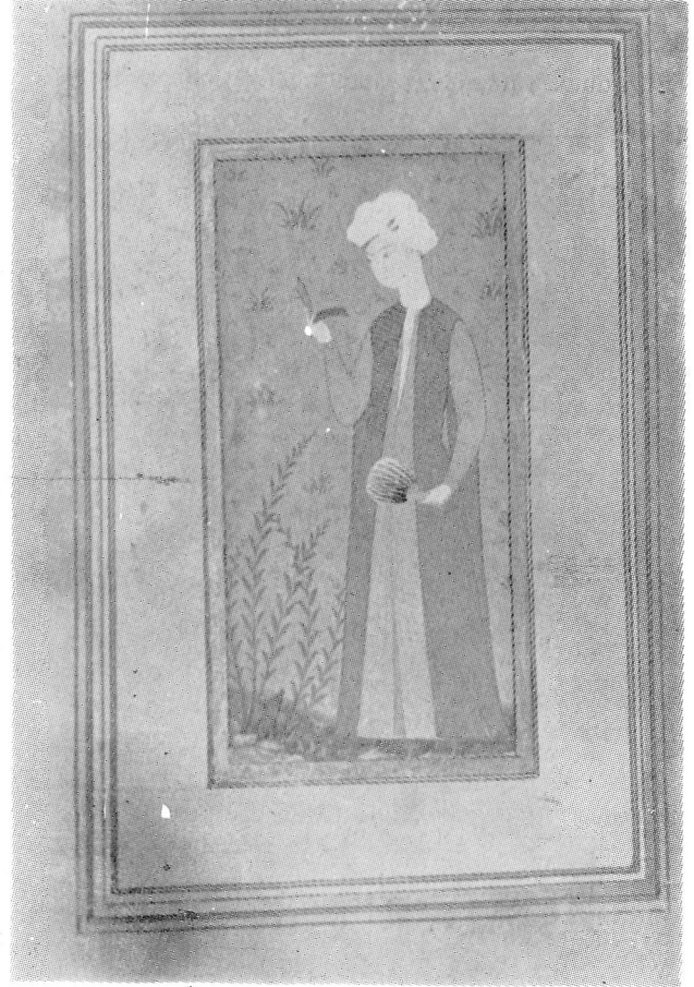
Res. 12— Okuyan genç. 17. yüzyıl Osmanlı. (TKSM, H. 2168, 32v).