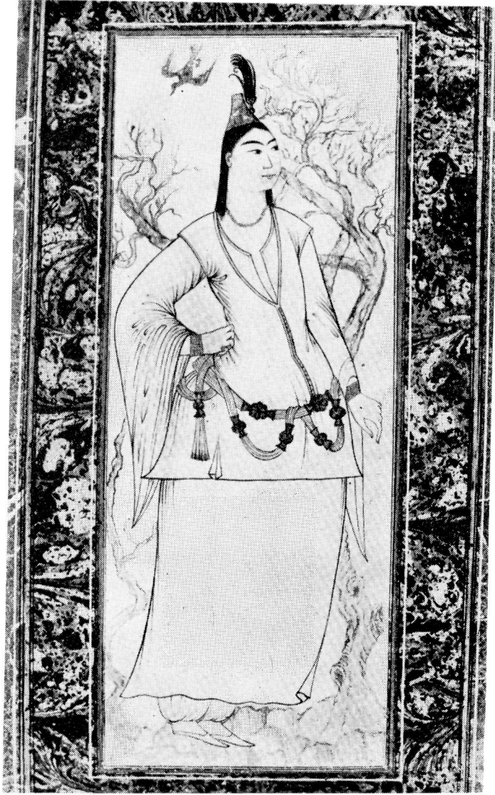
Res. 2— Eli belinde kadın. 17. yüzyıl Osmanlı. (TKSM, H. 2135, 26r).