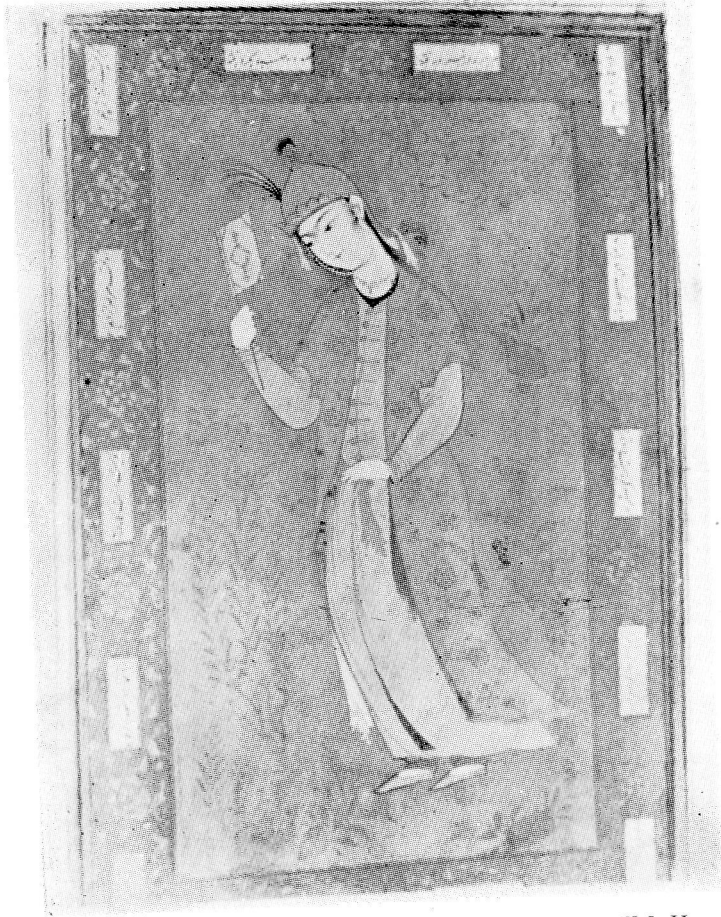
Res. 9— Eli yelpazeli kadın. 17. yüzyıl Safavi. (TKSM, H. 2158, 6v).