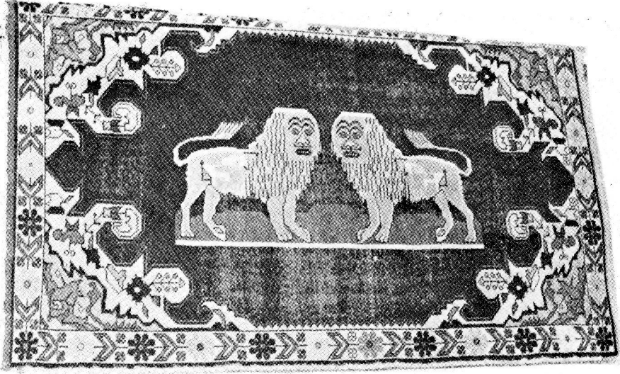
Res. 15— Kırşehir, oda halısı 1950-1960, 225x1.40 cm.