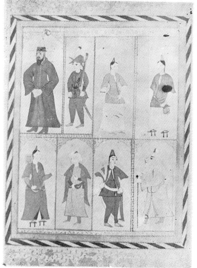
Res. 6— Bir albüm sayfası. 17. yüzyıl tasvirleri. Osmanlı. (TKSM, B. 408, 27r).